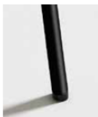
NEGRO / RAL 9005 Black Noir