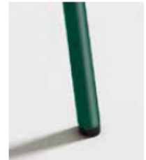
VERDE / RAL 6028 Green Vert