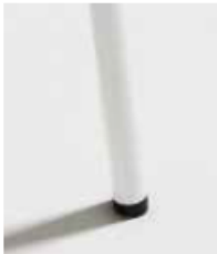
BLANCO / RAL 9003 White Blanc

(color texturado / textured color / couleur texturée)