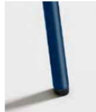
AZUL / RAL 5010 Blue Bleu