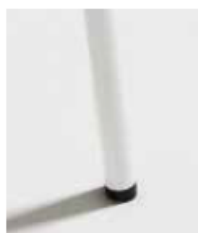
BLANCO / RAL 9003 White Blanc

(color texturado / textured color / couleur texturée)