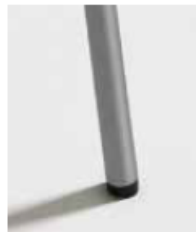
ALUMINIO / RAL 7045 Aluminium Aluminium