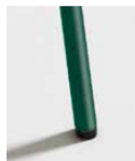
VERDE / RAL 6028 Green Vert