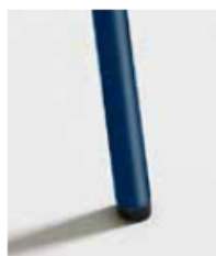
AZUL / RAL 5010 Blue Bleu