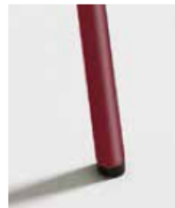
BURDEOS / RAL 3005 Bordeaux Bordeaux